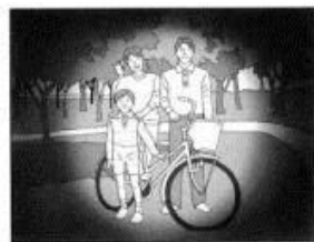
【視野狭窄の見え方の例】

また、視野の中に見えない部分が生じた場合、その部分を暗点といい、特に中心部が見えなくなる状態を中心暗点と言います。